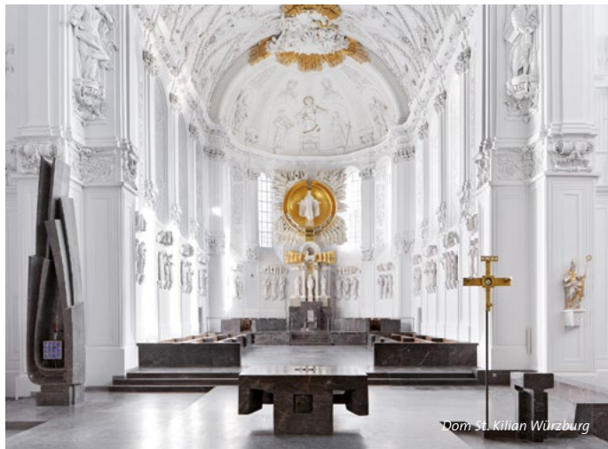
Dom St. Kilian Würzburg

Schubert „Winterreise“, Liederzyklus nach Gedichten von Wilhelm Müller, D 911