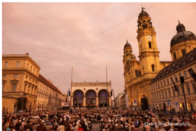
Klassik am Odeonsplatz