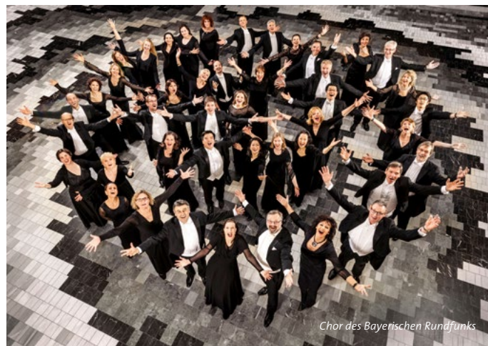
Chor des Bayerischen Rundfunks

Werke von Dittersdorf, Mozart, Zink, Knöferle u. a.