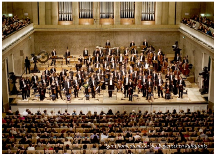
Symphonieorchester des Bayerischen Rundfunks

Mozart Adagio h-Moll, KV 540 Beethoven Sonate c-Moll, op. 111 „Diabelli-Variationen“ C-Dur, op. 120